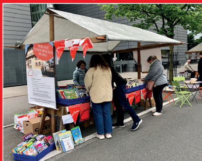
Bücherflohmarkt an der Marktmeile