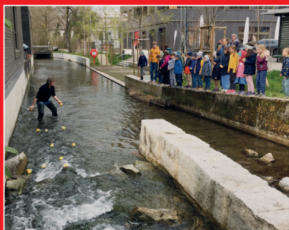
Entenrennen auf der Sure