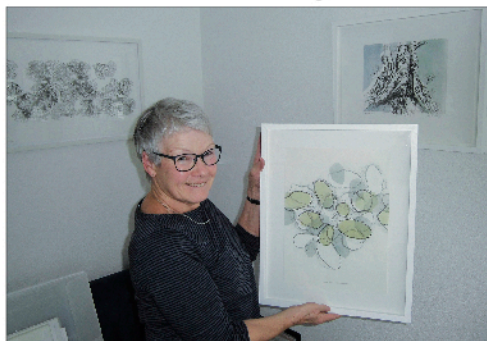
Lithografien in einer alten Drucktechnik...

Januar bis Juni 2018: Ausstellung Theres Scheiwiller