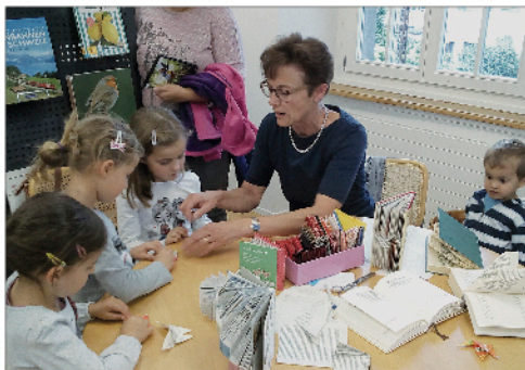
Falten mit der Künstlerin