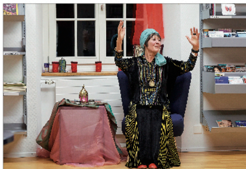
Orientalischer Märchenabend für Erwachsene...